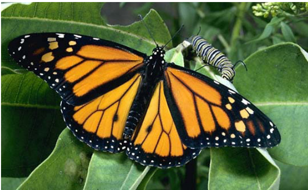
Een afbeelding met een resolutie van 150 DPI